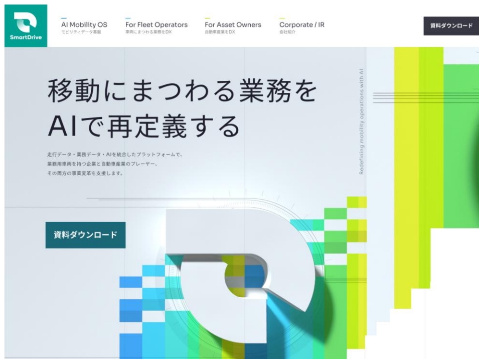
【コーポレートウェブサイトのTOPページ】