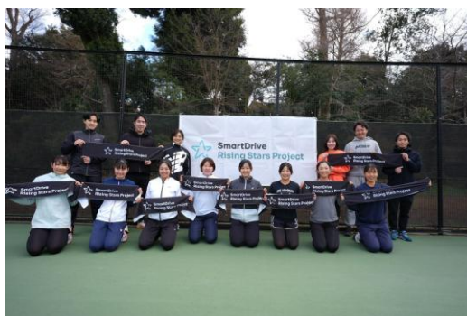
【SmartDrive Rising Stars Projectの様子】

また、2014年の第1回大会から支援を続ける「東北風土マラソン」の運営サポートや、大学でのデータ活用に関する授業の実施など、多岐にわたる取り組みを行う予定です。