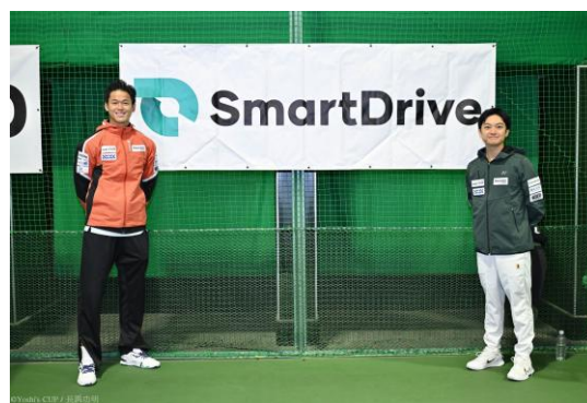
【Yoshi's CUP の様子】

また、2014年の第1回大会から支援を続ける「東北風土マラソン」の運営サポートや、大学でのデータ活用に関する授業の実施など、多岐にわたる取り組みを行う予定です。