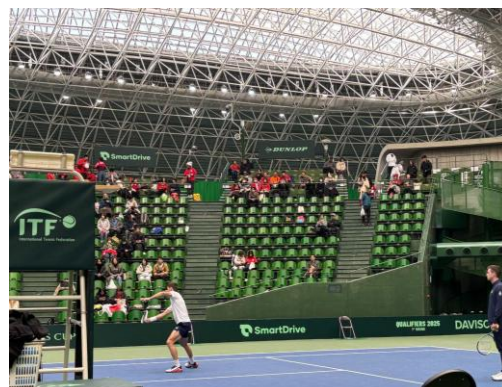
【デビスカップの様子】